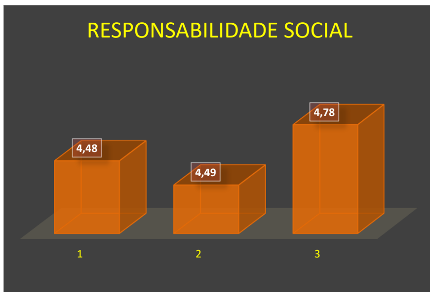
Gráfico 2 - Dimensão 3 – Responsabilidade social

A FASAR realiza diversas ações sociais por meio de parcerias com entidades (Lar de Velhice Maria de Souza Spínola, APAE, Hospital municipal, Projeto Girassol, dentre outras) do município de Novo Horizonte e região, com o objetivo de estimular a aprendizagem com significância para os discentes da IES e ainda fazer a diferença de maneira positiva na vida das pessoas e entidades que mais precisam. O desempenho da Dimensão 3 é ilustrado pelo Gráfico 2.