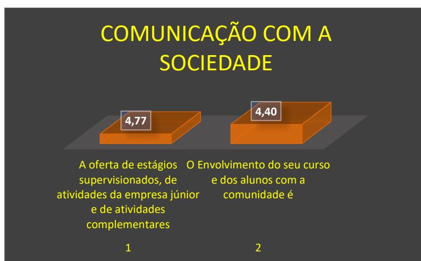
Gráfico 3 - Dimensão 4 - Comunicação com a sociedade

O Gráfico 3 apresenta uma visão geral do desempenho da dimensão 4.